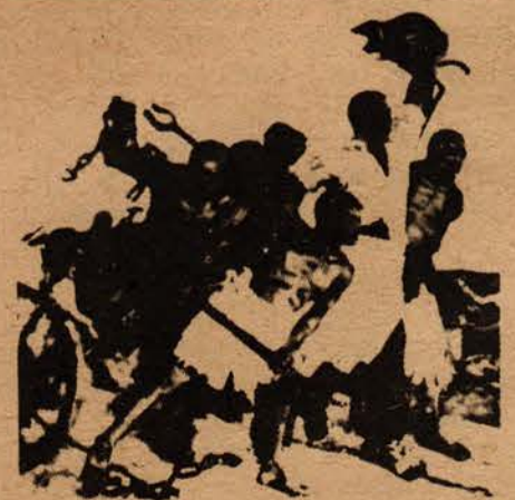
Lou Kuang-pin, Yang Yi-yen